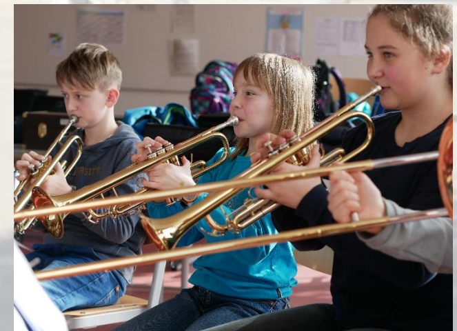
Bläsergruppe 5 a/b im Februar 2019